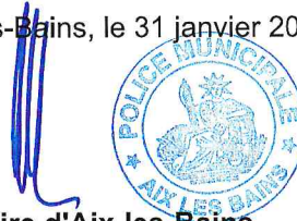
Le Maire d'Aix-les-Bains Renaud BERETTI